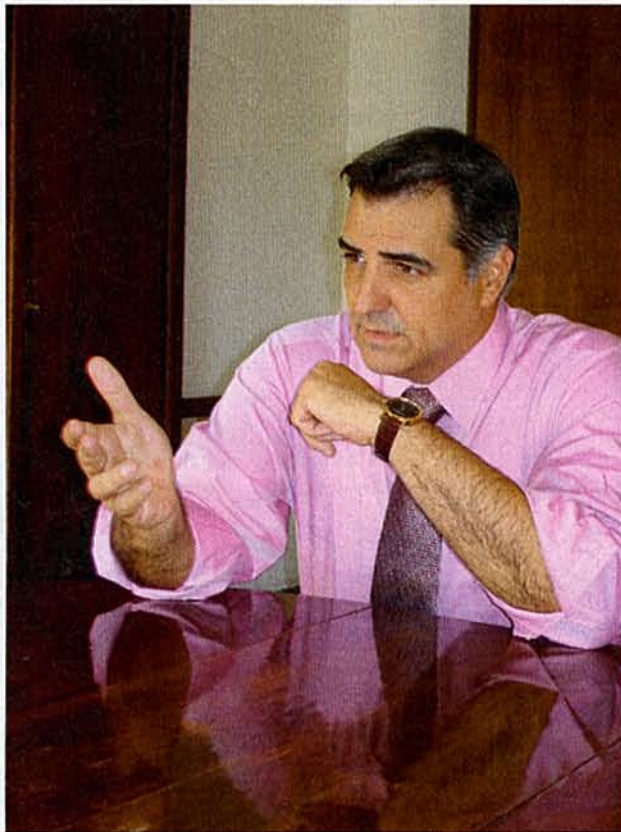
HDZ je moja opcija isto kao i SDP, HSS, HNS, HSLS... Svi su oni moja opcija u onom dijelu u kojem prihvaćaju da se Hrvatska danas mora braniti ekonomskom politikom, tvrdi naš sugovornik

➤ "Do sada smo se ponašali arogantno i bahato jer smo svake godine dobivali oko sedam milijardi eura tuđeg novca, a onda smo ga olako trošili. Da smo ga teškom mukom zaradili, drukčije bismo se ponašali"